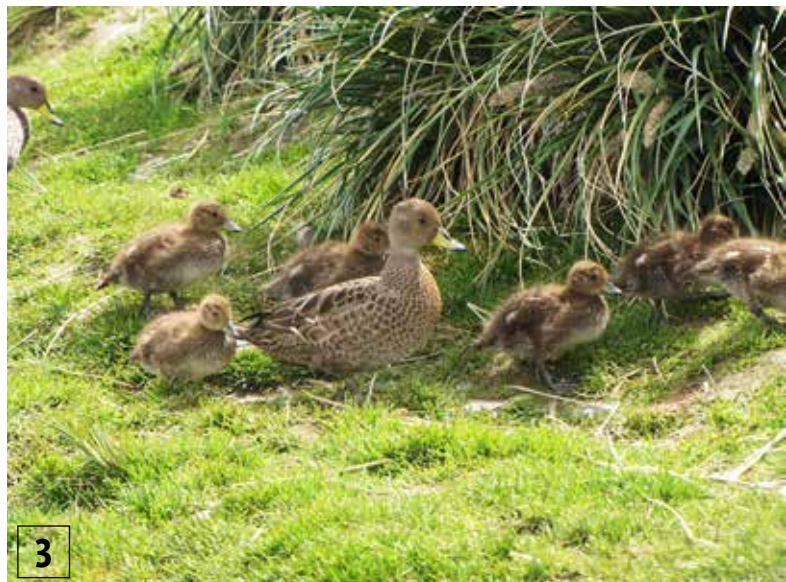
3 Südgeorgische Spitzschwanzente mit Küken

Für Vegetation ist auf Südgeorgien wenig Raum. Lediglich die Fjordregionen sind bewachsen und weisen ca. 50 höheren Pflanzen auf, daneben auch Moose und Flechten. Das Tussockgras hat für die Tierwelt eine besondere Bedeutung, es dominiert Südgeorgien. Sträucher und Bäume findet man keine.