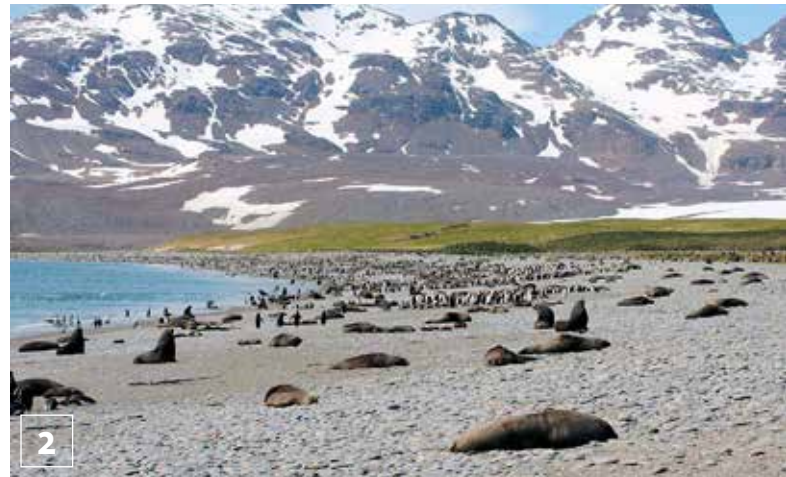
2 Robbenkolonie auf Südgeorgien

Mit dem Falklandkrieg begann 1982 auch für Südgeorgien ein dunkles Kapitel. Eine britische Militärgarnison wurde erst 2001 von Südgeorgien abgezogen. Sie hatte den Auftrag, argentinische Truppen von Südgeorgien fernzuhalten.